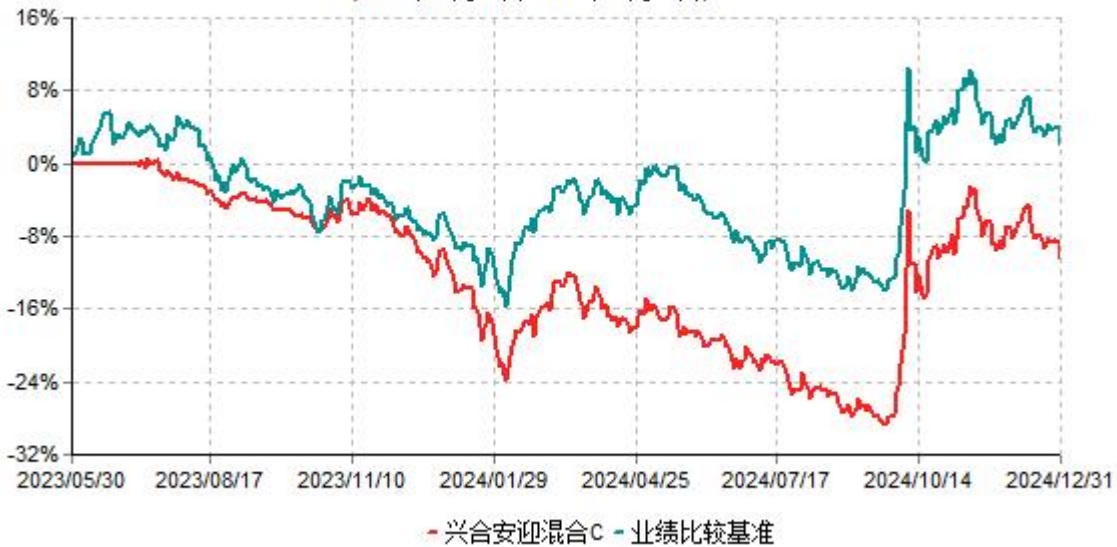
兴合安迎混合C累计净值增长率与业绩比较基准收益率历史走势对比图 (2023年05月30日-2024年12月31日)

注：本基金建仓期为基金合同生效日起的6个月。截至建仓期结束，本基金各项资产配置比例符合基金合同及招募说明书有关投资比例的约定。