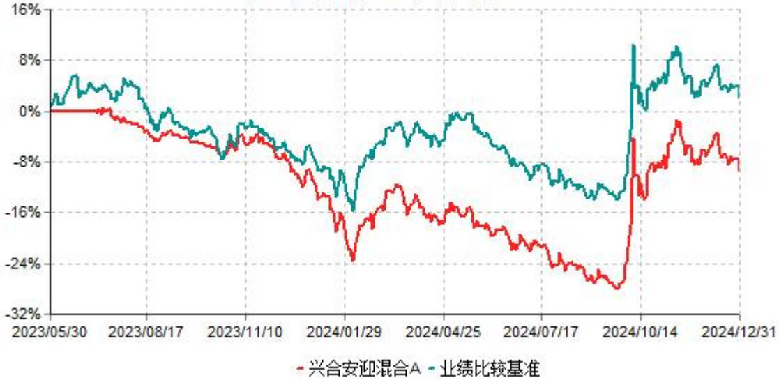
兴合安迎混合A累计净值增长率与业绩比较基准收益率历史走势对比图 (2023年05月30日-2024年12月31日)

注：本基金建仓期为基金合同生效日起的6个月。截至建仓期结束，本基金各项资产配置比例符合基金合同及招募说明书有关投资比例的约定。